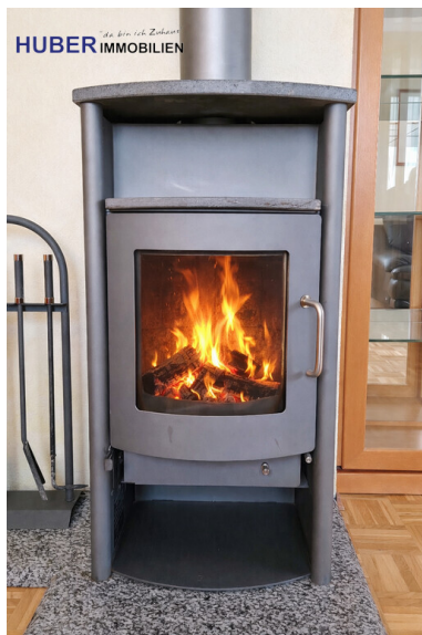
wohliche Wärme Ofen Specksteinverkleidert